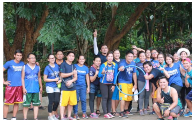
Ang nanalong grupo para sa ginanap na team building ay ang Blue Team. Sila ang grupo na nakatapos ng lahat ng activity sa pinakamabilis na oras.